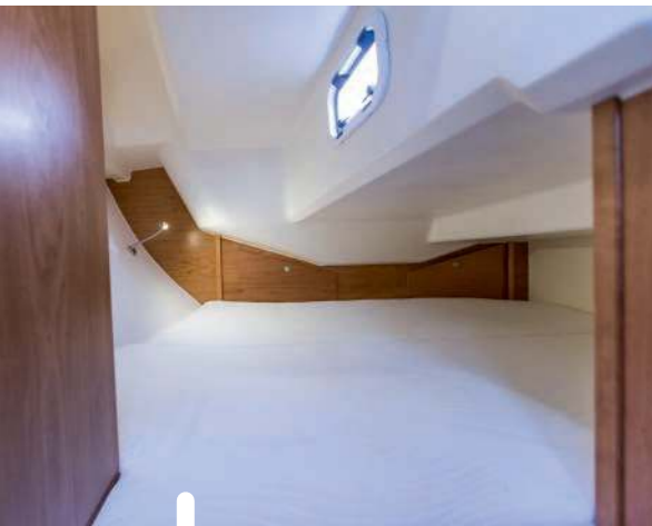
De kooi in de achterhut is dwarsgeplaatst. Behoorlijk groot, maar onder helling niet comfortabel.

Niet ambachtelijk, dat mag je in deze prijsklasse ook niet verwachten. Wel een pienter gebruik van de ruimte.